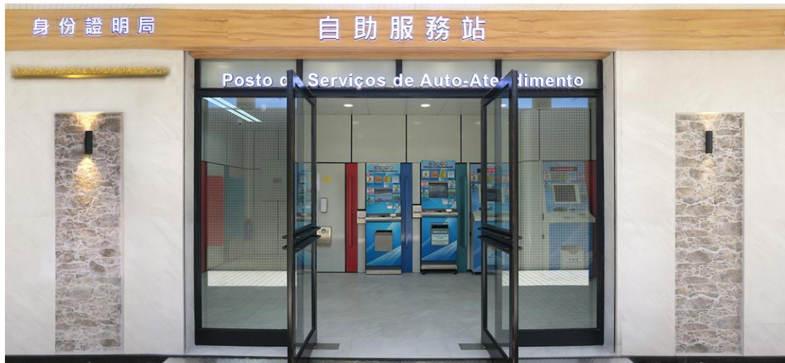
身份證明局自助服務站